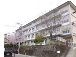
長崎市立山里中学校 徒歩約12分