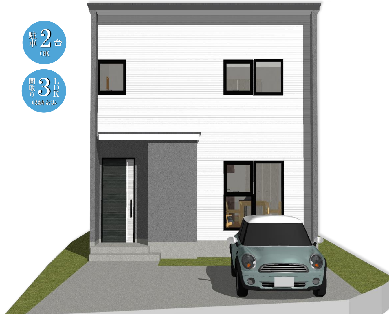
※パースは一例です。イメージの為、実際とは多少異なります。建物は現地建っておりません。お好みの外観カラーをお選びいただけます。