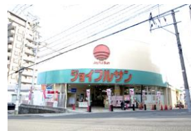
ジョイフルサン本原店 車約2分