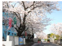
長崎市立高尾小学校 徒歩約15分