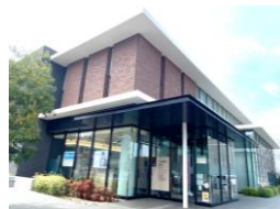
十八親和銀行 本原支店 徒歩約6分