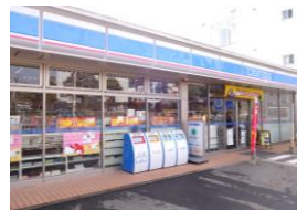
ローソン長崎大浦町店 徒歩約5分