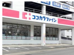
ココカラファイン三芳店 車約4分