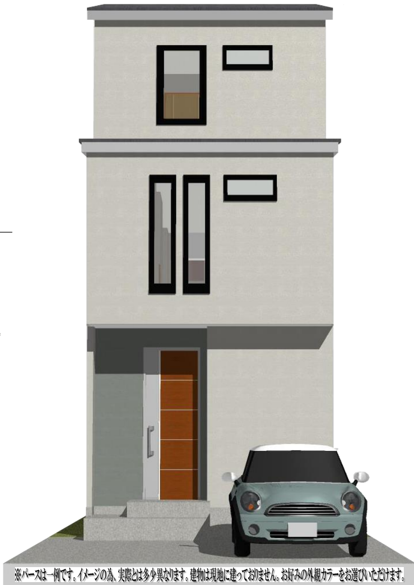
※パースは一例です。イメージの為、実際とは多少異なります。建物は現地に建っておりません。お好みの外観カラーをお選びいただけます。

【建築条件付宅地分譲】この土地は、土地売買契約締結後3ヶ月以内に(株)西部住宅販売、又は当社指定業者と建築請負契約を締結していただくことを条件として販売致します。この期間中に住宅を建築しないことが確定したとき、又は建築請負契約が成立しなかった場合には、土地売買契約は白紙となり、受領した金額は全額お返しします。