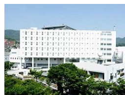
済生会長崎病院 車約7分