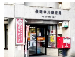
長崎中川郵便局 車約2分