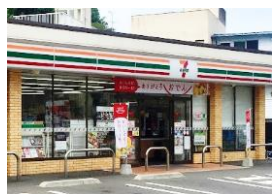
セブンイレブン 長崎中川1丁目店 徒歩約12分