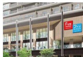
ジョイフルサン 新大工町ファンスクエア店 車約3分