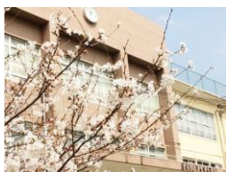
長崎市立 桜馬場中学校 徒歩約10分