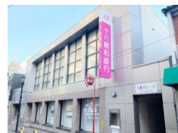
十八親和銀行 新大工町支店 車約5分