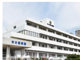
医療法人平成会 女の都病院 車約3分