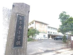
長与町立 長与南小学校 徒歩約24分