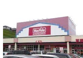
マックスバリュ長与店 車約4分