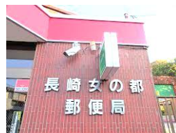
長崎女の都郵便局 車約1分