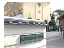
長与町立 長与第二中学校 徒歩約27分