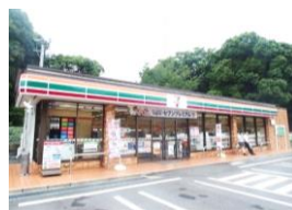
セブンイレブン 長与まなび野店 車約2分