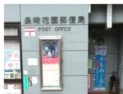
花園郵便局 車約2分