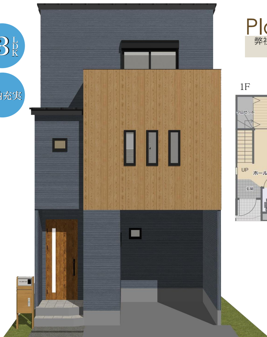
※パースは一例です。イメージの為、実際とは多少異なります。建物は現地に建っておりません。お好みの外観カラーをお選びいただけます。

【建築条件付宅地分譲】この土地は、土地売買契約締結後3ヶ月以内に(株)西部住宅販売、又は当社指定業者と建築請負契約を締結していただくことを条件として販売致します。この期間中に住宅を建築しないことが確定したとき、又は建築請負契約が成立しなかった場合には、土地売買契約は白紙となり、受領した金額は全額お返しします。