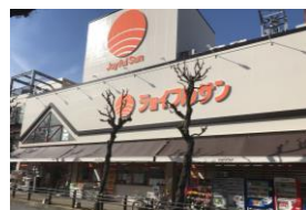
ジョイフルサン城栄店 車約3分