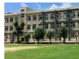
長崎市立 西城山小学校 徒歩約6分