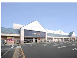
ミスターマックス 長崎店 車約7分