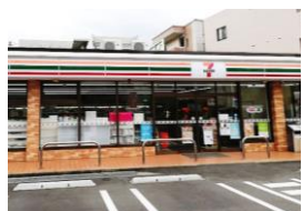
セブンイレブン 長崎花園町店 徒歩約7分