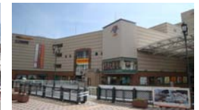
アミュープラザ長崎 徒歩5分