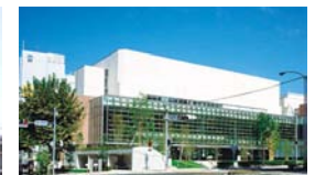
長崎市立図書館 車2分

【物件概要】◆所在地/長崎市御船蔵町◆交通/八千代町バス停徒歩1分◆用途地域/商業地域◆建物構造/鉄骨作 亜鉛メッキ鋼板5階建◆校区/西坂小学校・長崎中学校◆専有面積/53.61㎡◆間取/13LDK・10.5洋・9.2洋・4.3洋・6和・9.4洋◆敷地と道路の関係/敷地は4m幅の公道に間口が2m以上接する◆設備/都市ガス・水洗◆築年月/平成7年1月 ◆登録番号:3018