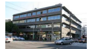
長崎中央郵便局 徒歩8分