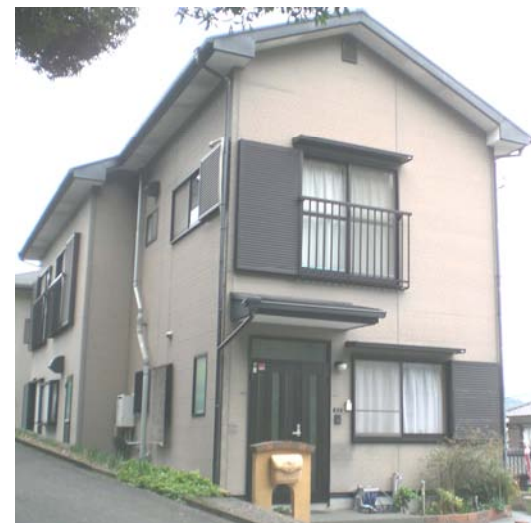
3年前に内装リフォーム!!きれいですよ♪