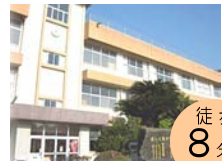
高田小学校 徒歩 8分!! (約640m)