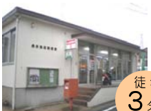
長与高田郵便局 徒歩 3分!! (約230m)

【建築条件付宅地】土地売買契約締結後、3ヶ月以内に当社と建築請負契約を締結して頂く事を条件として販売致します。この期間中に住宅を建築しないことが確定したとき、又は請負契約が不成立だった場合、土地売買契約は白紙となり、受領した金額は全額お返しします。